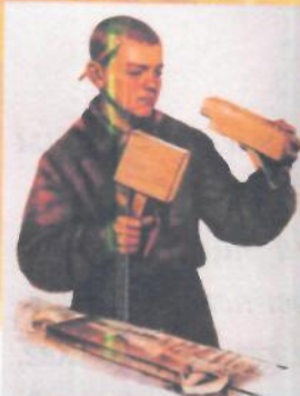
МАСТЕРСТВУ УЧИТЬСЯ - ВСЕГДА ПРИГОДИТСЯ!

Профессиональное образование начало свое становление еще во времена Древней Руси. Многочисленные археологические находки неопровержимо свидетельствуют, что в Древней Руси было превосходно налажено производ-